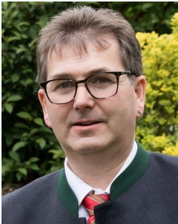
Roland Bades Maultrommelmacher Handgeschmiedete Maultrommeln / Sonderanfertigung, gestimmte Maultrommeln